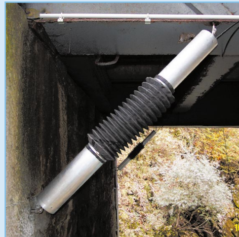
Vue détaillée de l'EX-Large, fixations sans jeu.