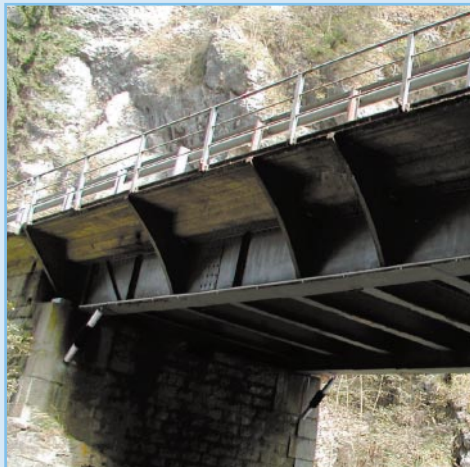
EX-Large mesure entre culée et pont.